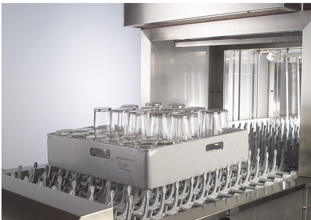
Tekoči trak zagotavlja enostavno rokovalje in hitro pomivanje