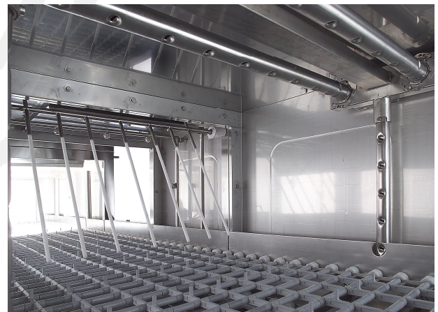
Zmogljive pomivalne in izpiralne roke ter široka komora