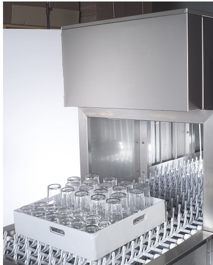
Velika vhodna in izhodna odprtina