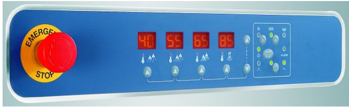
Elektronsko krmiljenje s pomočjo digitalnega displeja