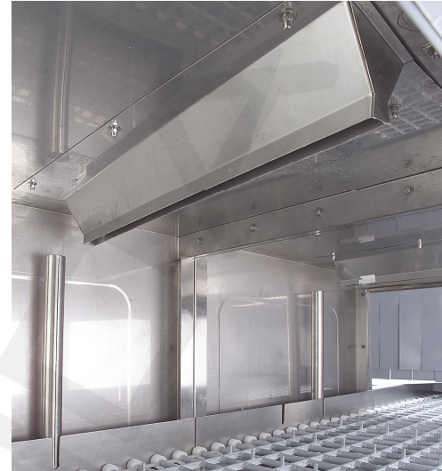
Ekonomično in učinkovito sušenje posode